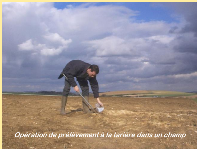
Opération de prélèvement à la tarière dans un champ

La pratique du non labour pendant plusieurs années concentre la matière organique en surface, mais le stock de carbone de la couche arable n'est pas obligatoirement fortement modifié et c'est ce stock qui est suivi.