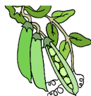
Les pois de conserve