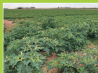
... pommes de terre