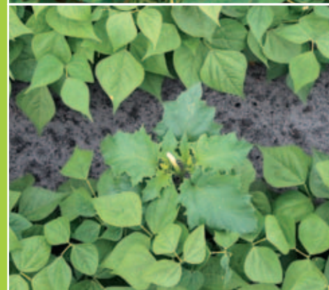
Daturas dans des cultures de haricots