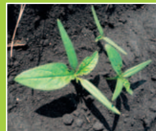
Cotylédons étroits et allongés et 1 ères feuilles à bords entiers