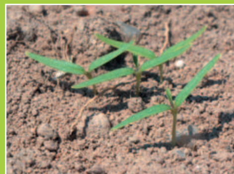
Les levées tardives de datura sont les plus problématiques car elles engendrent des plantes peu visibles, cachées sous le couvert des cultures.