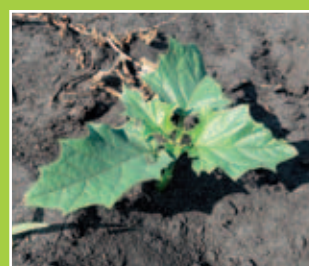
Limbe denté à partir de la 4 ème feuille