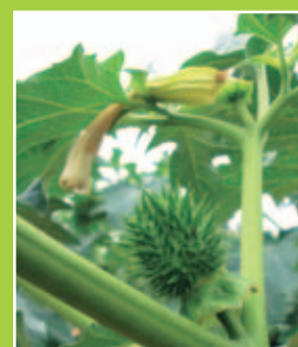
Fruit contenant jusqu'à 500 graines